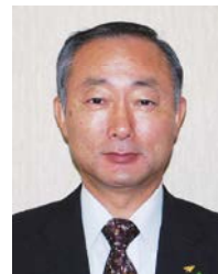
福島県双葉地方町村会 事務局長 兼 双葉地方広域市町村圏組合 事務局長