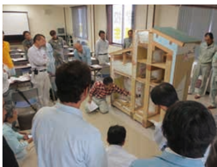
昨年度の施工技術者講習会の様子