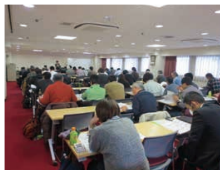
昨年度の設計技術者講習会の様子